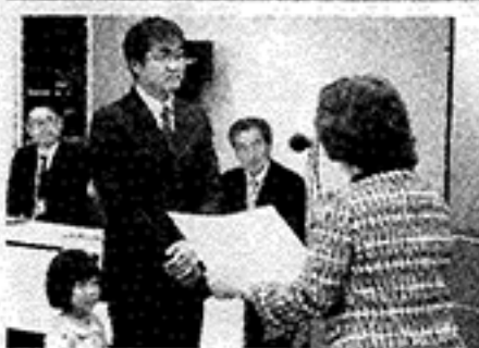
平成27年度 親と子のよい歯のコンクール表彰式